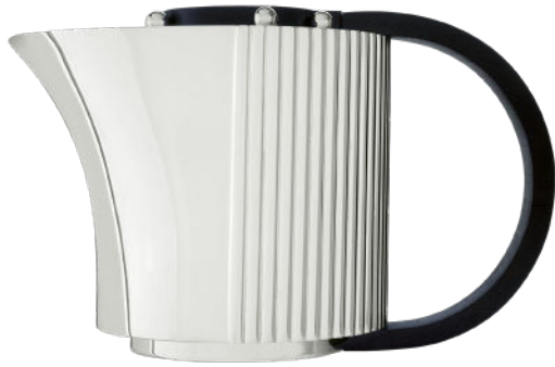
cafetière coffee pot

H. 14,5 cm | 120 cl H. 5.7 in | 42 fl oz