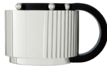
sucrier sugar pot

H. 8,5 cm | 45 cl H. 3.3 in | 15.8 fl oz