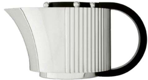
théière tea pot